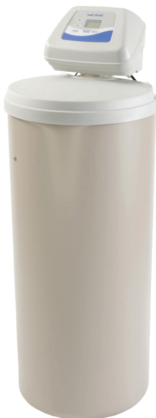
Réf. NSC 40UD

Adoucisseur haute performance de 30 litres de résine conçu pour de fortes consommations d'eau, idéal de petites collectivités, PME/PMI.